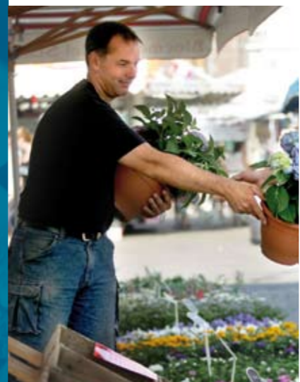
LWV van alle markten thuis...

Via het LWV magazine, de digitale nieuwsbrief en de website houden wij u op de hoogte van actuele ontwikkelingen en relevante informatie. Ook kunt u deelnemen aan voorlichtingsbijeenkomsten, het jaarcongres, de algemene ledenvergadering en nieuwjaarsreceptie waar wij u informeren en waar u collega-ondernemers ontmoet.